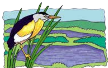
Riserva Naturale "Lago Preola e Gorgi Tondi" Ente Gestore WWF ITALIA ONLUS